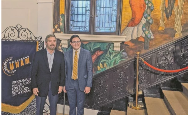
Juan Ramón de la Fuente fue el invitado de honor del acto del primer aniversario de la Red UNAM de Washington.

INICIO / NACIÓN / SEGURIDAD / MÉXICO, CERCA DE UN ASIENTO EN EL CONSEJO DE SEGURIDAD